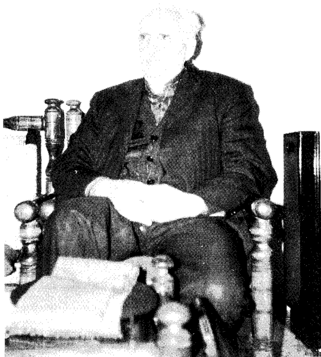
پروفیسور دوكتور زهتابی شکیل ۱۳۷۳-نچو ایلده چه کیلمیشدیر.